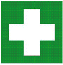
Primāras palīdzības zīme Nr.8.1.**

Uzlīmēt zīmes uz durvīm un jumta noteiktajā vietā, kur tiks izvietoti ugunsdzēsamais aparāts un aptieciņa.