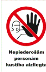
Aizlieguma zīme Nr.2.6.**

Par nepiederošo personu tiek uzskatīta ikviena persona, kura nav saistīta ar būvuzņēmēju ar darbuzņēmuma līgumu vai neattiecas pie Pasūtītāja speciālistiem. Nepiederošo personu piekļūšana būvobjektā ir iespējama tikai ar atbildīga būvdarbu vadītāja vai projekta izpildes koordinators atļauju, pārvietošana būvobjektā ir iespējama tikai ar pavadības personu , visa personas jābūt apģērbtas individuālas aizsardzības līdzekļos.